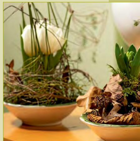
▲ Kleine Energiebündel

Und das gilt nicht nur für Frauen. Auch Männer können sich laut Studie nicht der positiven Wirkung von Blumen entziehen. Beide gaben an, sich mit Blumen weniger traurig und ängstlich zu fühlen, dank der floralen Aufmerksamkeit aber mehr Lebensfreude zu empfinden.