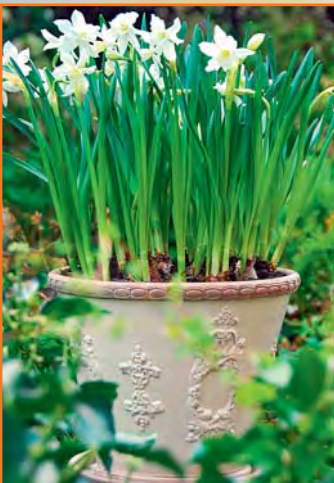
▼ Duftende Narzissen im Topf

Auch wenn Sie im Herbst kleine Zwiebeln gepflanzt haben, brauchen Sie auf Narzissen nicht zu verzichten. Jetzt sind vorgetriebene Pflanzen in Töpfen erhältlich, die entweder schon blühen oder noch in der Knospe stehen. Sie lassen sich ganz einfach mit dem Topfballen in Töpfe und Schalen pflanzen und auch wieder herausnehmen, wenn sie verblüht sind. Unter den kleinblütigen Arten finden sich etliche, die nicht nur entzückend aussehen, sondern auch duften. Dazu gehören zum Beispiel die stets mehrblütigen Tazetten mit den Sorten 'Geranium' und 'Sir Winston Churchill', die zudem noch gefüllt blüht. Auch die Gruppe der Jonquilla-Narzissen zeichnet sich durch köstlichen Duft aus. Besonders schöne zweifarbige Blüten haben zum Beispiel die Sorten 'Quail' und 'Pipit'; 'Baby Moon' hingegen ist besonders zierlich und passt noch in die kleinste Lücke.