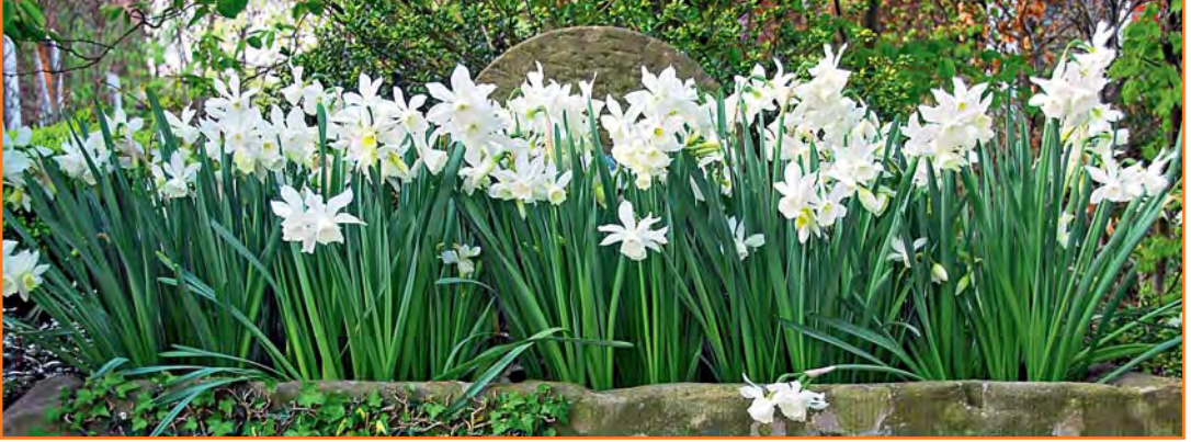
▲ Kleinblütige Narzissen sind die ideale Bepflanzung für Tröge