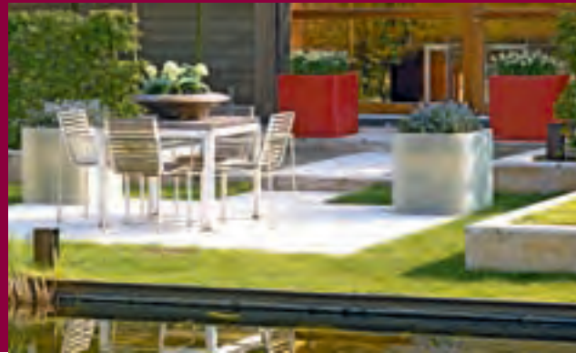
▲ Jeder Garten ist so individuell wie sein Besitzer. Wer gerade Formen und wenig Schnickschnack liebt, wird sich auf dieser Terrasse wohlfühlen.

ja), Spierstrauch (Spiraea) oder Rispen-Hortensien werden Ihnen den Rückschnitt durch dicht besetzte Blütentriebe danken. Auch Formgehölze sollten regelmäßig gestutzt werden, damit sie ihre Gestalt behalten. Viele Obstbäume und Beerensträucher kann man hervorragend im Frühjahr pflanzen. Vor allem für wärmeliebende Pfirsiche und Aprikosen ist die Frühjahrspflanzung zu empfehlen. Dann sind die härtesten Fröste vorbei und können den Pflanzen nicht mehr schaden. Jeder Garten ist so individuell wie seine Besitzer: Er ist eine eigene klei-