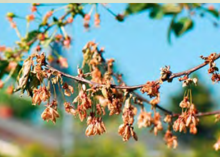
▲ Monilia-Spitzendürre bei einer Sauerkirsche