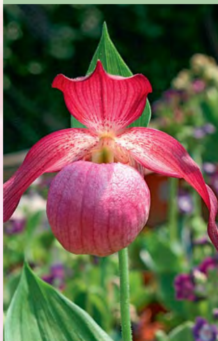
▲ Eine kleine Kostbarkeit: Winterharte Orchideen für den Garten.

Die verschiedenfarbigen Cypripedium-Kreuzungen aus deutscher Züchtung sind sehr gut für den Hobbygärtner geeignet, der die Schönheit der Natur in seinen Garten holen möchte.