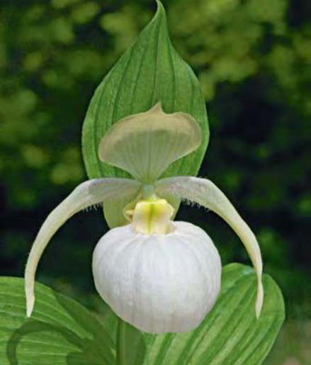
▲ Cypripedium 'Sabine Pastell'

beispielsweise im Oktober, wenn der Spross bereits eingezogen hat.