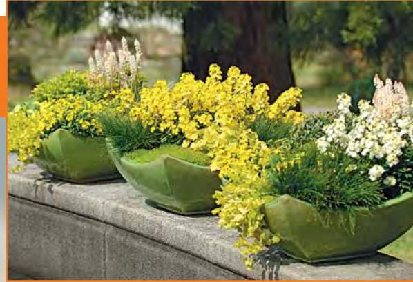
▲ Schalen mit duftendem Goldlack