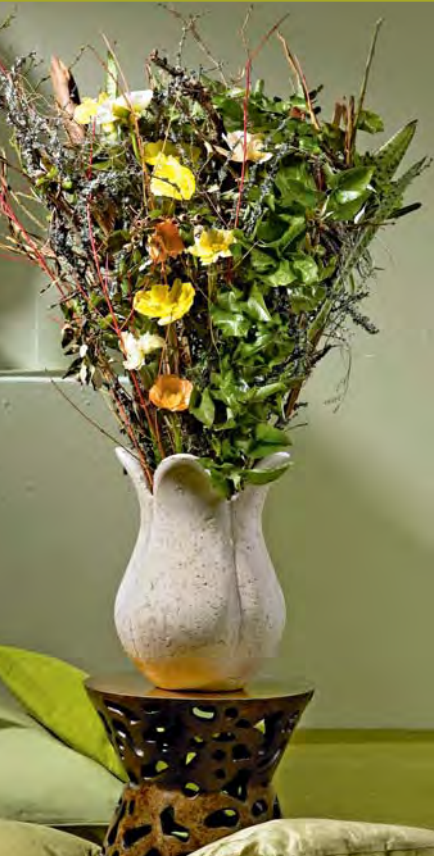
▲ Gestecktes Arrangement: Der Winter weicht dem Frühjahr – Blattgrün und Blüten in harmonischem Einklang

Ein Strauß Blumen löst echtes Lächeln aus und kann Ihnen den Tag retten, ein gutes Gefühl vermitteln und Sie in beste Stimmung versetzen. Blumen machen wirklich glücklich!