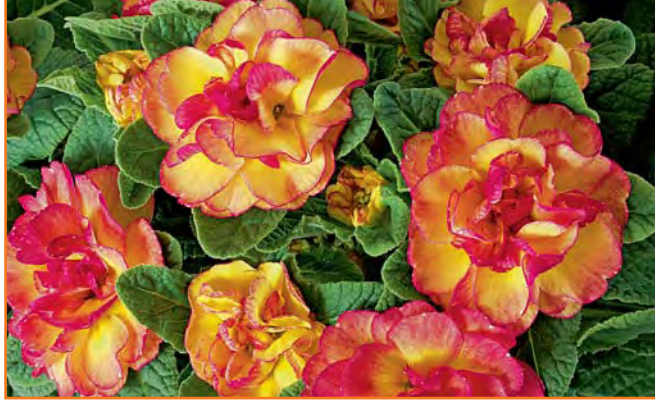
▲ Primula 'Nectarine'