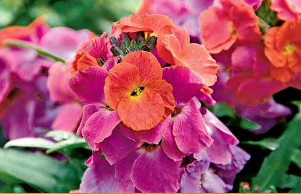
▲ Erysimum 'Winter-Orchidee'