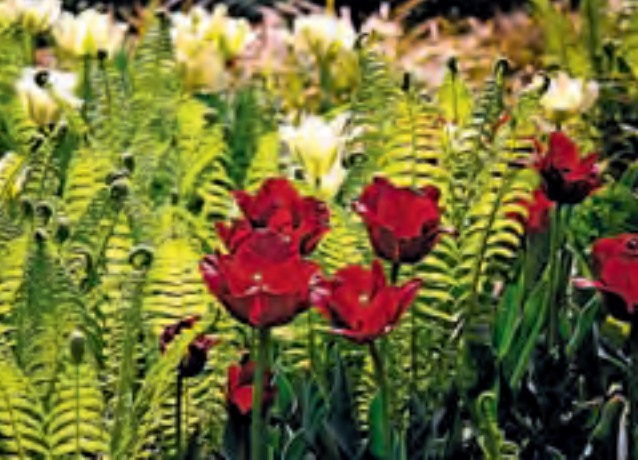
▲ Die dunkelroten und weißen Tulpen stehen schon in voller Blüte. Einen wunderschönen Kontrast dazu bilden die hellgrün leuchtenden Farne.