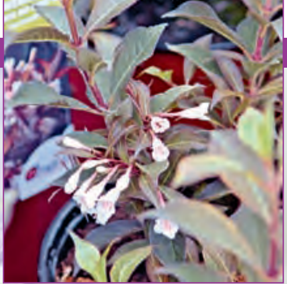
▲ links: Hibiskus syriacus 'Sugar Tip', rechts: Weigela 'Black and White'