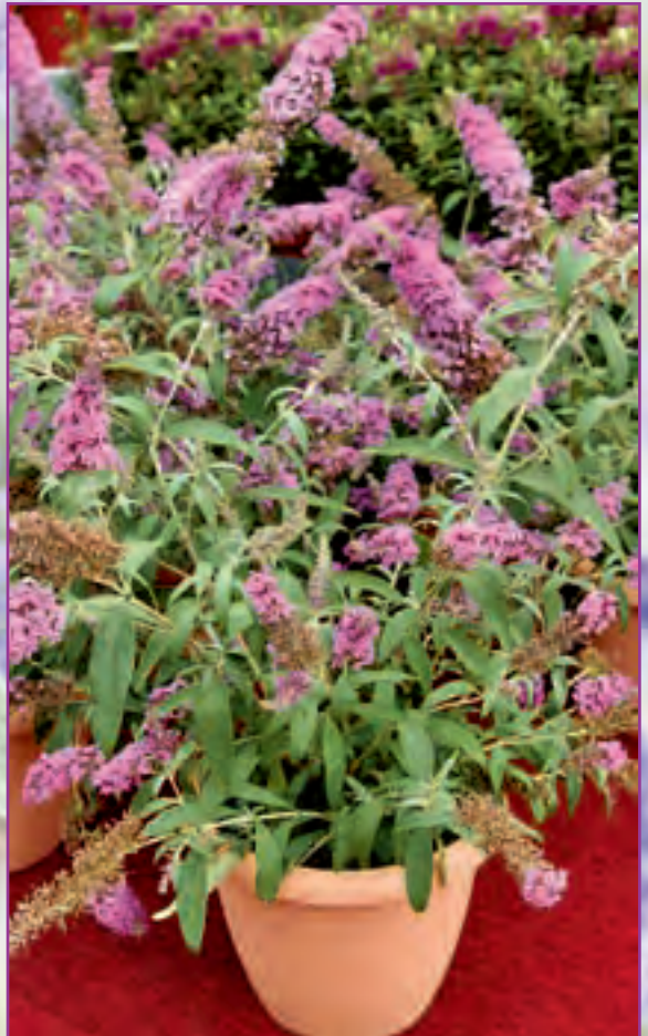
▼ Buddleja 'Buzz Pink Purple'