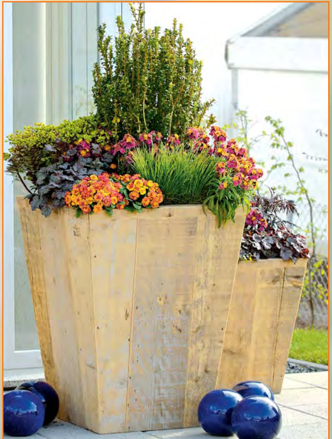
▼ Frühlingsbepflanzung mit Primeln, Goldlack und verschiedenen Blattschmuckpflanzen