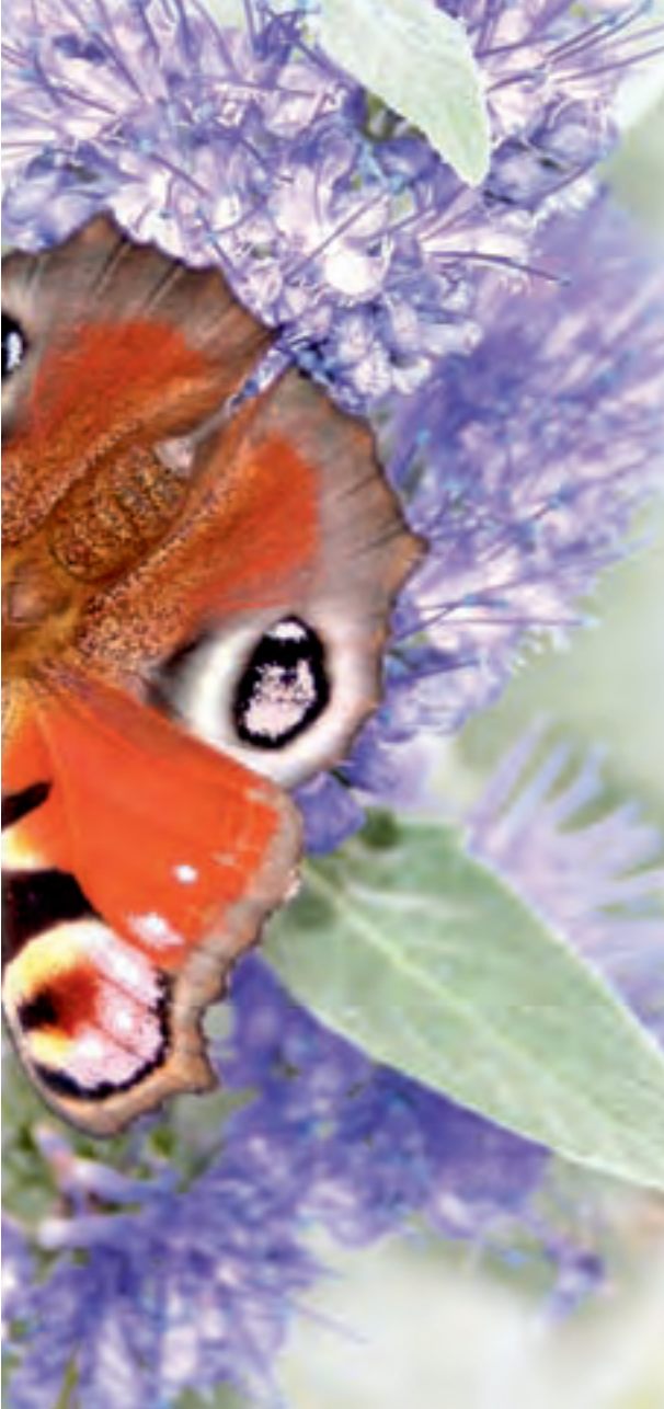
◀ Auch die Bartblume 'Caryopteris' zieht mit ihren blauen Blüten Schmetterlinge an.