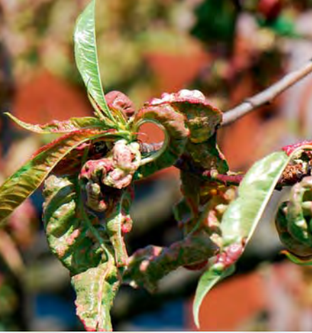
▲ Kräuselkrankheit des Pfirsichs

Der Schadpilz ( Taphrina deformans ), der diese Krankheit hervorruft, überwintert an den Triebspitzen (Knospenschuppen und Rinde) seiner Wirtspflanzen. Bei beginnendem Knospenschwellen werden die Pilzsporen durch Feuchtigkeit (Regen) in die sich öffnenden Knospen gespült und infizieren dort die jungen neuen Blätter. Erste Anzeichen der Erkrankung zeigen sich bereits kurz nach Beginn des Austriebs.