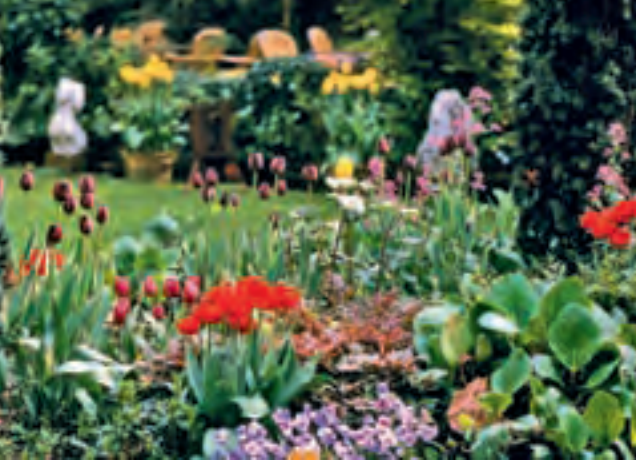
▲ Bald ist die Freiluftsaion im grünen Wohnzimmer eröffnet. Als muntere Frühlingsboten zeigen sich Tulpen und Stiefmütterchen in vollem Format.