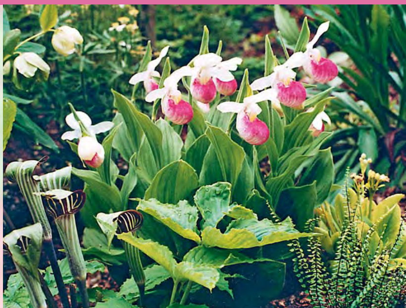
▲ An ein halbschattiges Plätzchen in gut drainierte Erde gepflanzt, bilden Cypripedium im Laufe mehrerer Jahre stattliche Horste.